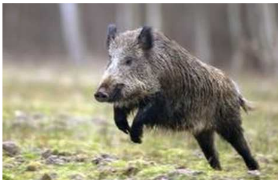
L'un des objectifs des chasseurs est de réguler la population de grands gibiers, dont les sangliers.

En France les dégâts causés par le grand gibier aux cultures agricoles (ce qui exclut les dégâts sur forêt) oscillent annuellement entre 25 millions à 40 millions d'euros. Pour notre département, en moyenne ce sont 400 000€ de dégâts aux cultures qui sont indemnisés.