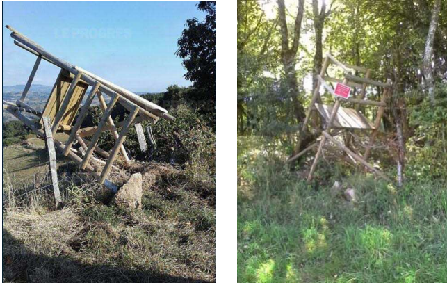
Des miradors vandalisés

Ces miradors ont pour but de favoriser des tirs fichants (tirs dirigés vers le sol) et de limiter les ricochets. Malheureusement, depuis le début de l'année, 4 de ces miradors ont été vandalisés, cassés ou couchés au sol. Une plainte a été déposée.