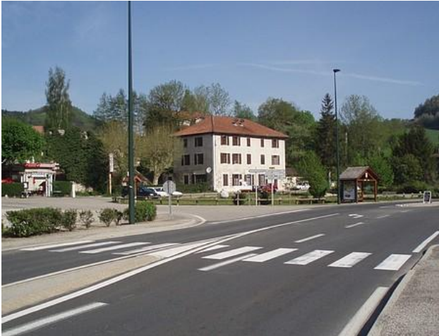
Sécurisation du passage piéton au Col