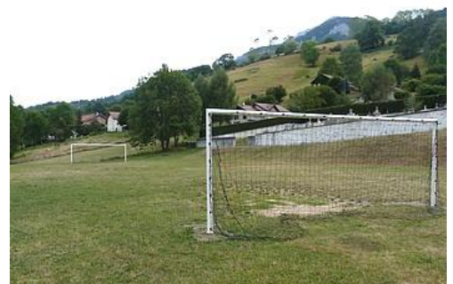
Nouvelles cages de foot