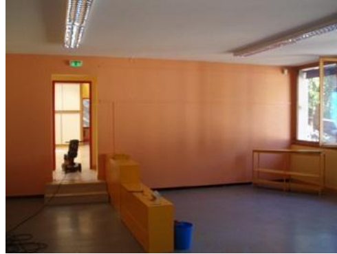
Peinture à l'école et remplacement des menuiseries