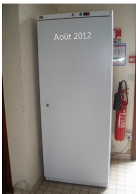
Frigos et four à la Maison du Temps Libre