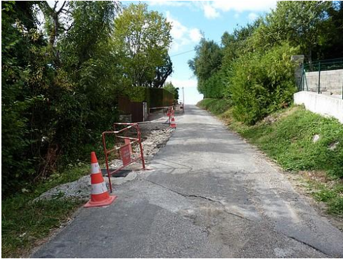
Reprise d'enrobé route des 3 fontaines