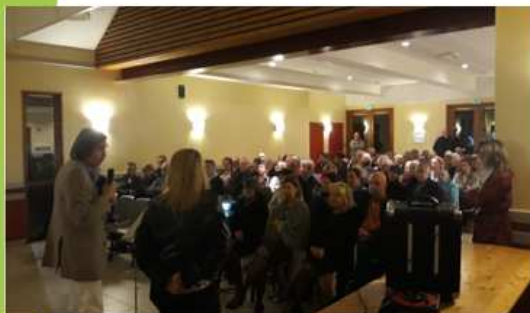
11/01/2020 - Vœux de la municipalité