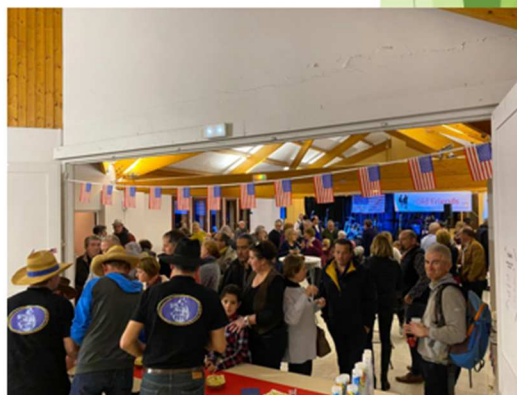
15/02/2020 - Concert OLD FRIENDS - Comité des fêtes