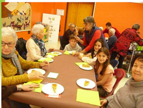
17/01/2020 - Le Club et les enfants tirent les Rois