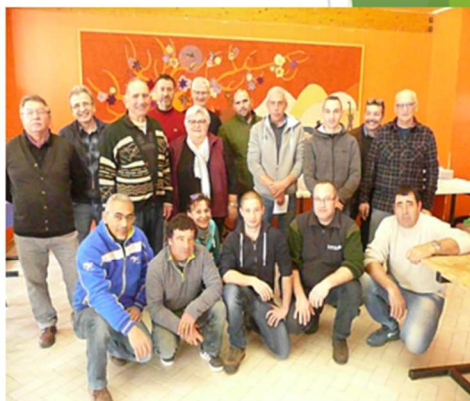
19/01/2020 - Matinée Boudins ACCA de Pommiers la Placette