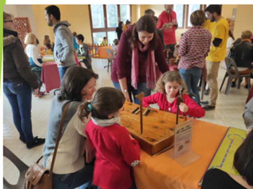
26/01/2020 - Après-midi Jeux - Sou des écoles