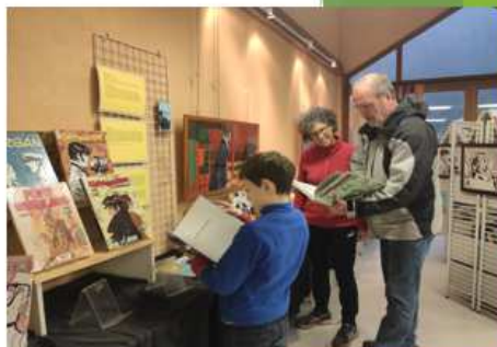
11/02/2020 - Exposition BD « Corto Maltèse »