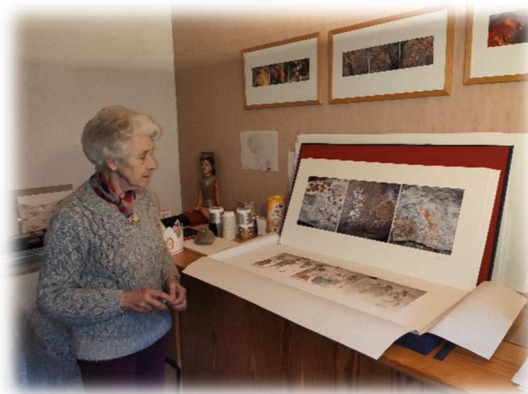
Photographie - Jean VEDEL

Au fil des années mon terrain de prédilection s'est diversifié : photographie du patrimoine rural comme les lavoirs où l'eau est le génie du lieu, de l'iconographie en sculpture comme La Pietà, les "Choses" comme par exemple les pages de livres dont les formes sont différentes suivant la façon dont le livre est posé, de la matière comme la roche et ses différentes structures révélées par la lumière (je parle dans ce cas de photos "Aléatoires") sans oublier mes amis de toujours les arbres certains plus attirants plus photogéniques que d'autres.