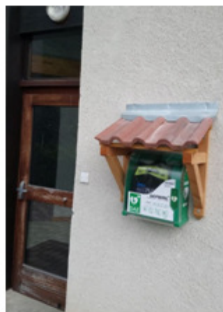
Maison du Temps Libre de Pommiers la Placette