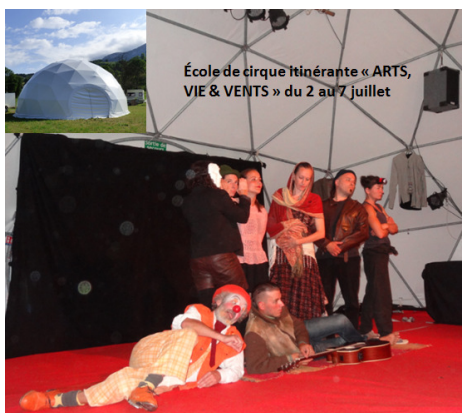
Photographie – Sophie NALLET – « Arts, Vie et Vents »