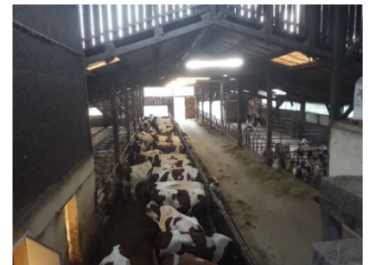
La stabulation

Ces productions sont destinées à l'alimentation du cheptel - soixante dix vaches lactantes de race Montbéliarde - et environ autant de génisses. Le GAEC a un droit à produire de 540 000 litres de lait/an. Cette production n'est pas transformée sur place mais enlevée par l'Etoile du Vercors (entreprise rachetée par Lactalis) et sert de matière première à la fabrication du Saint Félicien. Plusieurs critères concourent en dehors du marché à fixer le prix d'achat du litre de lait au producteur: à un prix de base se rajoutent des critères qualitatifs.