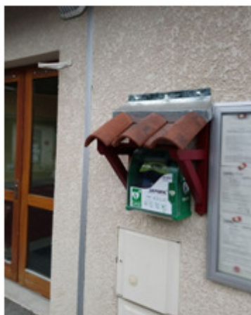
Salle des fêtes de St Julien de Ratz

Deux défibrillateurs Automatisés Externes (DAE) conçus pour permettre à toute personne même non médecin de sauver une vie en administrant une décharge électrique à une victime d'arrêt cardiaque sont mis en service depuis le 5 septembre 2018.