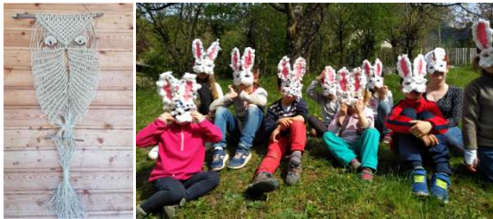
Hibou en macramé et Les petits lapins

Les activités sont variées et surtout, l'effectif étant très raisonnable, les enfants ont le choix et ne sont jamais bousculés par le temps. Un grand hibou en macramé a été réalisé, symbole de l'école. Tout se déroule dans le calme et la sérénité.