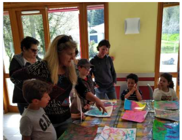
Création des paysages imaginaires avec l'artiste Odile Tanton.

Les sorties prévues du vendredi sont sous réserve de l'autorisation des parents, de véhicules avec assurance appropriée pour transporter des enfants.