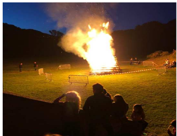
Une soirée du 22 juin 2019 réussie avec comme beau symbole la participation des habitants des 2 villages et des jeunes prêts à danser jusqu'au bout de la nuit.

Cette nouvelle équipe vient de faire son baptême du feu lors de la fête de la Saint-Jean qui fait partie avec la Vogue des rendez-vous annuels incontournables pour la commune.