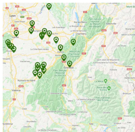
Carte : Nids de frelon asiatique détruits sur le département de l'Isère en 2019

Les conditions climatiques de l'année semblent avoir été défavorables au prédateur. Malgré tout, le frelon asiatique continue sa progression.